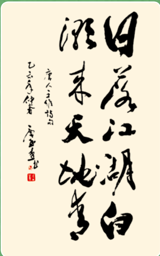
唐至量錄王維詩：日落江湖白，潮來天地青