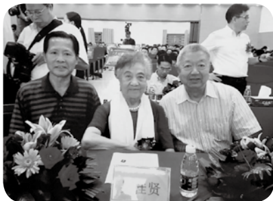
左起：唐至量、原國務院副總理 吳桂賢、筆者。