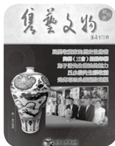
《雋藝文物》 雜誌創刊號封面