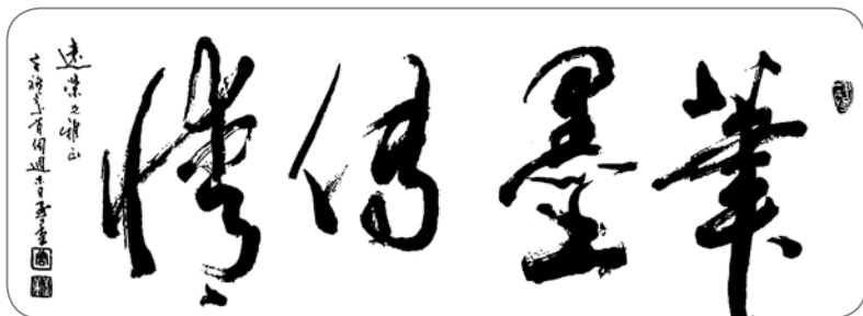
唐至量贈送筆者墨寶