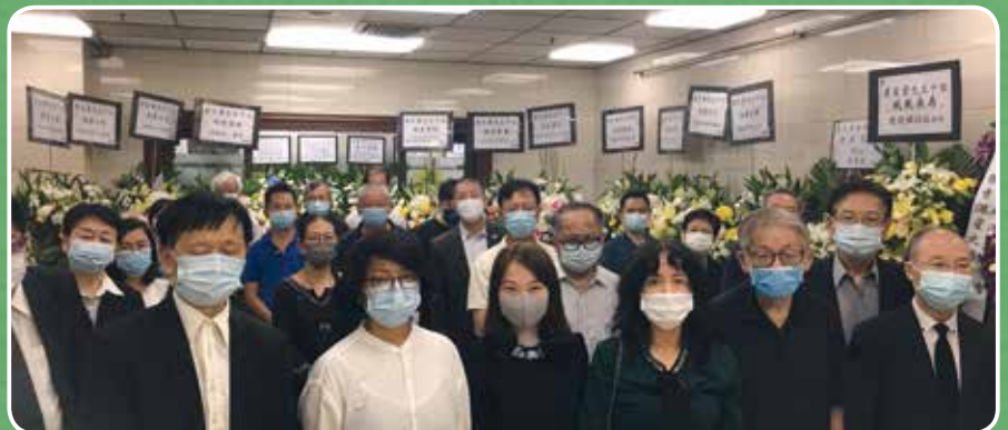
唐至量追思悼念會現場